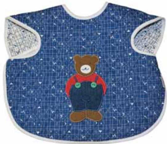
Ärmellätzchen Bär blau Art.-Nr. .... 090609