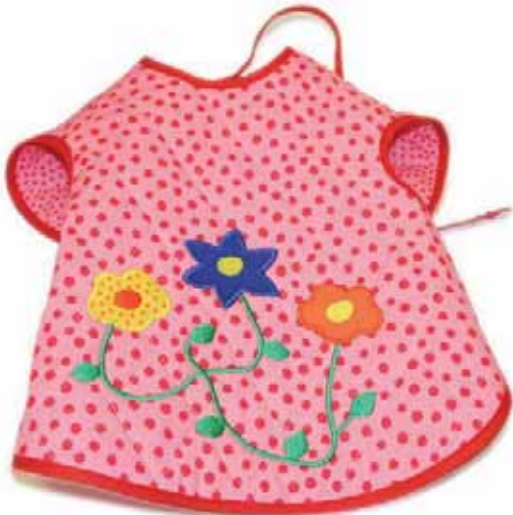
Ärmellätzchen Blume Art.-Nr. .... 090606