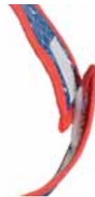
Lätzchen Louisa Art.-Nr. .... 090601

Buntes Lätzchen mit Maus-Motiv und einem Klettverschluss zum verschließen. Das Lätzchen ist ebenfalls aus hochwertigem Steppstoff und leicht in der Waschmaschine zu reinigen.