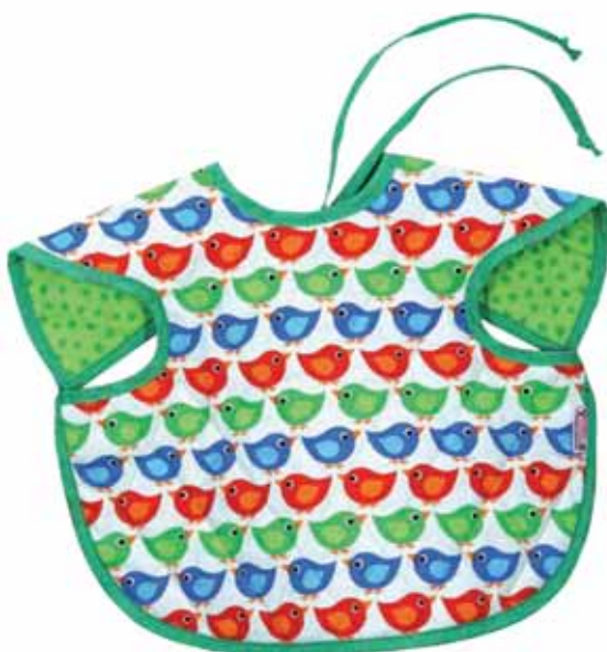
Ärmellätzchen Piepmatz Art.-Nr. .... 030019

Bunte Lätzchen aus 100% Baumwolle mit Schleife. Die Lätzchen sind ebenfalls aus hochwertigem Steppstoff und leicht in der Waschmaschine zu reinigen. Alle verwendeten Stoffe sind nach DIN EN 71 Teil 3 geprüft und haben das Zertifikat OEKO-Tex® Standard.