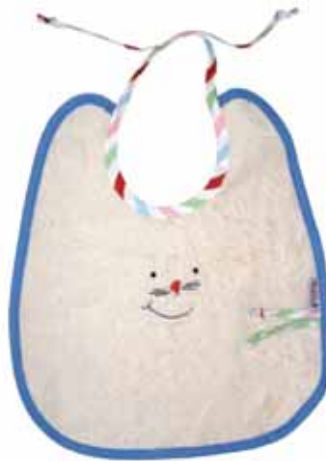
Schleifenlätzchen Kathi Art.-Nr. .... 030003

Unsere Maus Kathi in Lätzchenform gibt es in zwei Varianten. Beide sind aus Frotteestoff gefertigt.