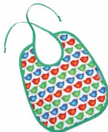
Schleifenlätzchen Piepmatz Art.-Nr. .... 030020