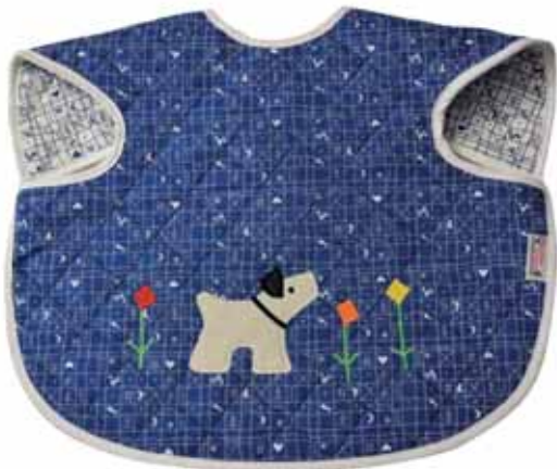
Ärmellätzchen Struppi blau Art.-Nr. .... 090604