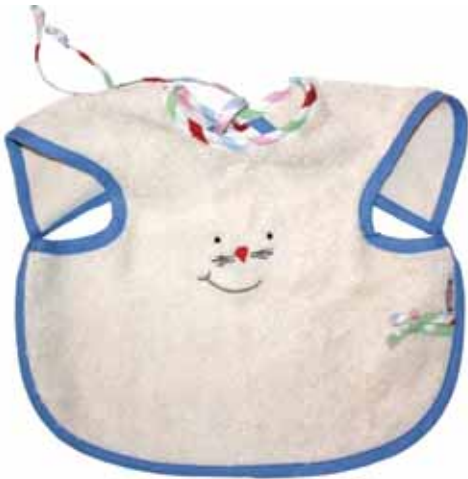
Ärmellätzchen Kathi Art.-Nr. .... 030004