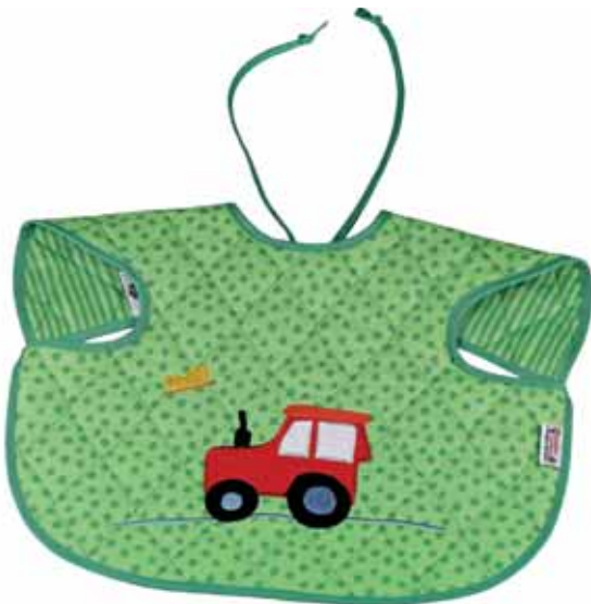
Ärmellätzchen Trecker grün Art.-Nr. .... 090605