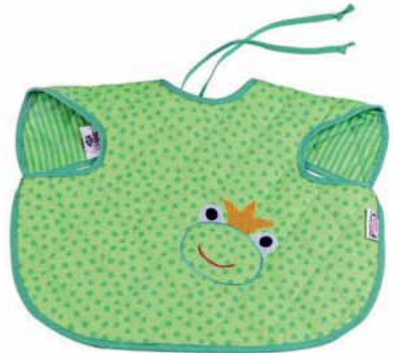
Ärmellätzchen Fritz Art.-Nr. .... 030045