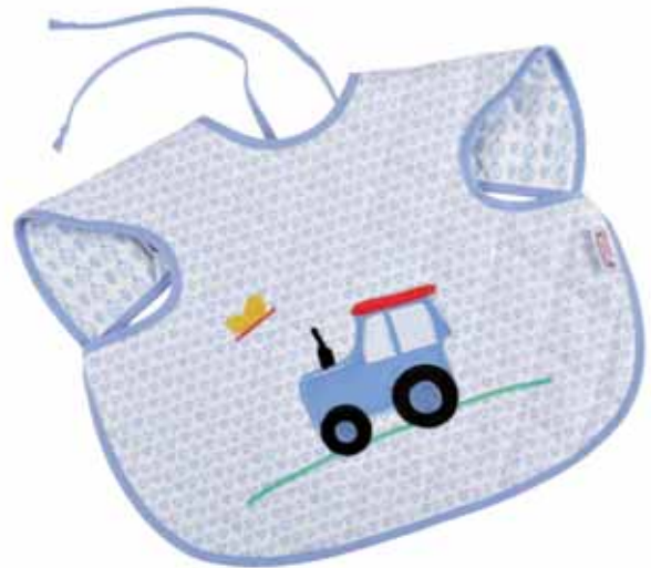
Ärmellätzchen Trecker hellblau Art.-Nr. .... 030039

Alle Lätzchen sind leicht in der Waschmaschine zu reinigen.