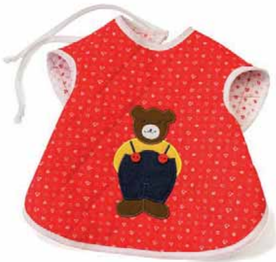
Ärmellätzchen Bär rot Art.-Nr. .... 090608

Bunte Lätzchen aus 100% Baumwolle mit Schleife. Die Lätzchen sind ebenfalls aus hochwertigem Steppstoff und leicht in der Waschmaschine zu reinigen. Alle verwendeten Stoffe sind nach DIN EN 71 Teil 3 geprüft und haben das Zertifikat OEKO-Tex® Standard.